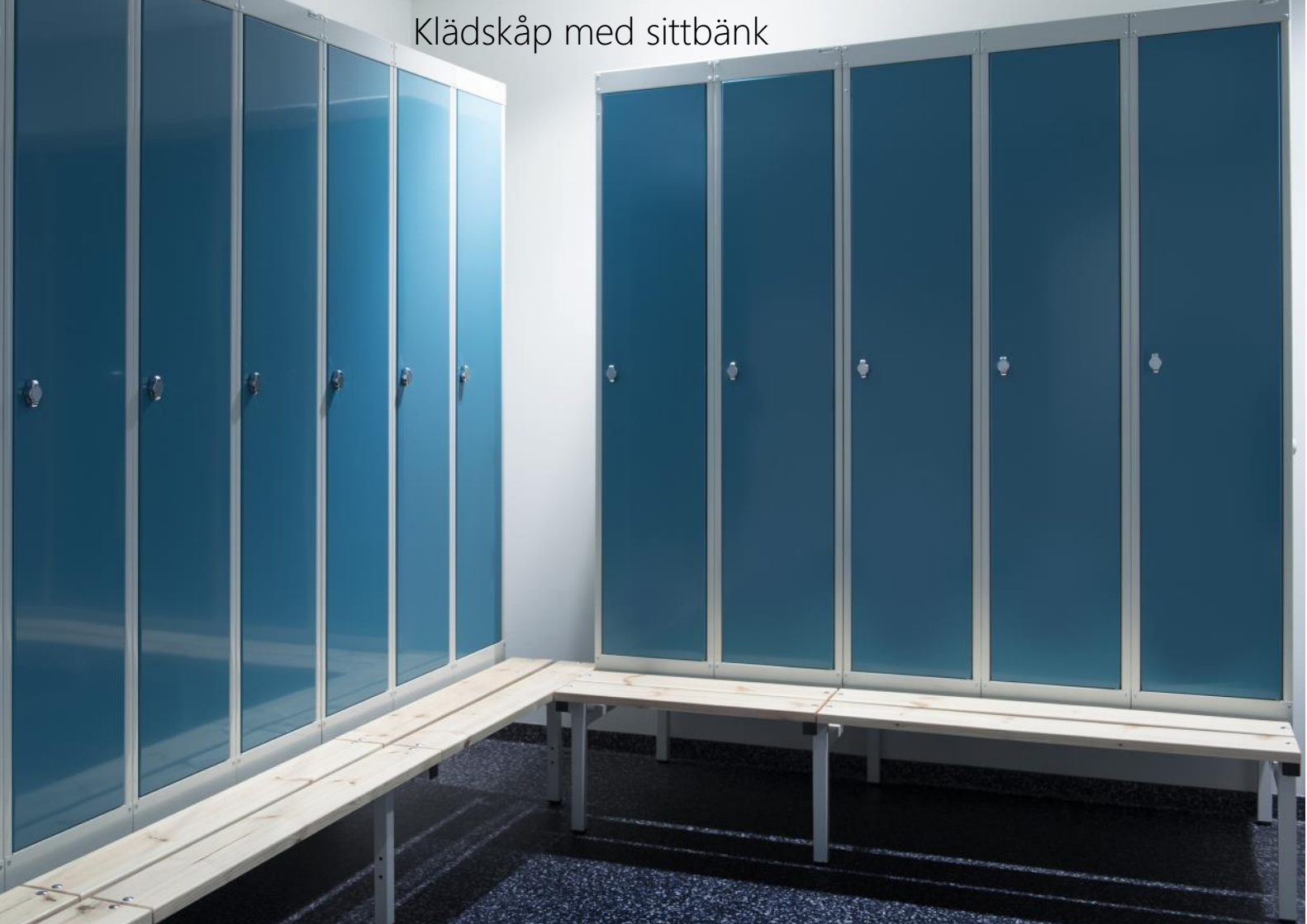
Klädskåp med sittbänk