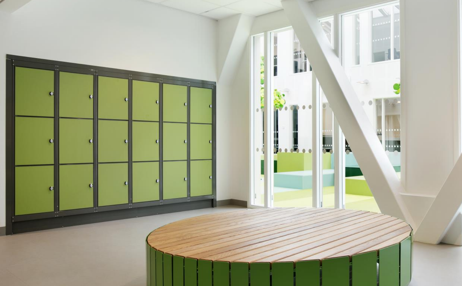
Mora Inredningar - Kläd & Förvaringskåp - Industriinredningar